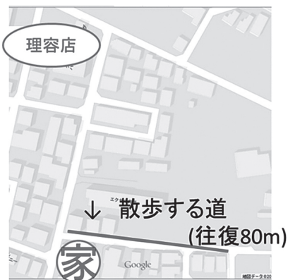
図2 本症例に提示した地図

実験デザインはABA B'A法とした。各時期は4セッションとし、全時期で20セッションとした。A期では前述の介入方法で実施し、妻から散歩回数を報告してもらうこととした。B期では散歩場所の地図を渡した(図2)。B'期ではB期の条件に加え、散歩したらカレンダーにシールをはることとした。なおこの実験は春に実施し、散歩の回