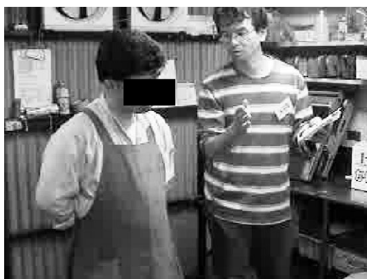
写真3 担当者の指示の受け入れが良好となる

介入援助後の全体像：表情は、柔和な顔つきとなり、人懐っこい明るさを持つ印象であった。対人関係は、会うと必ず会釈をするように変化した。仕事に対して自信を持ち、店員のやり方の批判が強くなった発言が増えた。