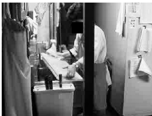
写真2 まな板消毒作業 段取りがスムーズになる

職場介入援助から3ヶ月経過した後の本事例の全体像および神経心理学的所見と検査結果は次のとおりである。