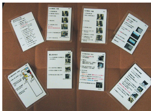
写真1 閉店業務マニュアル

一つ一つの業務を細分化したフローチャートである「閉店業務マニュアル」（以下、マニュアル）を本人専用で作成した。目的は、1) 店員の介助や指示を受けずに担当業務を遂行する、2) 他の閉店業務従事者は状況判断で行っている業務を本人は許容範囲内で規定の対応をすることにする、3) 業務の手順を固定化させることでやり忘れを回避するため、である。従来店舗で使用されていた閉店マニュアルは、業務全体のルールが中心であり、それだけでは不十分であった。マニュアルの内容を本人・母親に確認してもらい、理解できて見やすい内容・形態にした。その際、使用する漢字や用語、言い回しなど細かく意見を確認した上で取り入れた。また、店長・店員にも配布し、本人からの質問があった際、マニュアルに沿って指導し取り入れていない内容、変更事項はその都度丁寧に教えるよう依頼した。本人には、順番どおりに行うこと、作業内容を常に確認できるよう常備しておくことを指示した。母親は日常的にマ